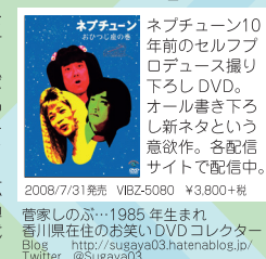
2008/7/31発売 VIBZ-5080 ¥3,800+税 管家しのぶ・1985年生まれ 香川県在住のお笑いDVDコレクター Blog http://sugaya03.hatenablog.jp/ Twitter @Sugaya03

三位一体。この言葉がこれほど似合うトリオは他にないだろう。どんな状況でも臨機応変に鋭いツッコミで対応するリーダー・名倉潤、様々なキャラクターを愛憎自在に演じる原田泰造、天真爛漫に場を掌握する最強のポケコミッショナー・堀内健。それぞれがそれぞれに突出した個性を放っているのに、三人が揃うと唯一無二のネプチューンの笑いが生み出される。そんな彼らが真価を発揮するのが、本作に収録されているようなスタンジオンだ。ポケ・ツッコミが入り乱れ、縦横無尽に繰り広げられるコントの数々……発売から10年もの歳月が経過した今も、その面白さは当時とまるで変わらない。時代に迎合しない不変不朽の名作、是非ご覧下さい。