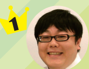
タイムマシーン3号・関 (太田プロダクション)

ここまで清潔感のあるぽっちゃりはなかなかない。(ぼんず・20代フリーター)丸いフォルムにサスペンダーの衣装がかわいい。(びよんびよ・20代会社員)