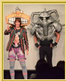
スーパーニューニューウ (マセキ芸能社/芸歴4年) 『皇帝戦士』 大将：ビッグバン・ペイダの甲冑

脳みぞ夫：鳥帽子だけ、100円均一で集めた素材で作りました。わりとイメージ通りに作れたと思います。コント衣装については、新ネタで、衣装にお金をかけて、いざやってみたらスベった...では、衣装が損なので、まずは有り合わせのチープな衣装でやります。これが若手芸人のリスクヘッジです。