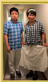
トッピード (太田プロダクション/芸歴16年) 『答え合わせ』『内見』など 和賀：後氏 新妻：後女

木下：THE小学生という分かりやすくベタな子供向けの恰好です。コントの際、必ずカッパも被ります。子供を演じる時はおっぱいが多いです。 木本：ベテラン野球選手の私服という設定です。「どこで買ったの? 多分高いよね、その服」「でも何でそれ選んだの?」という疑問が湧く衣装を探しました。