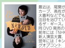
2014/09/24発売 ANSB-55175 ¥3,000+税

他に類を見ない独創的な設定のコントを得意とするザ・ギースが、結成10周年を記念してリリースしたベスト盤だ。手で触れたものの名前を声に出さずにはいられない男との打ち合わせ、正しい歩き方が分からない生徒を丁寧に指導する教習所、我が子の出生の秘密をクイズで告白する父親等、ヘンテコで印象的なコントが揃っている。とりわけ、マンヒストには嬉しいのに、地球にはめっぽう優しい女王様のプレイを描いた「SMの世界」は傑作だ。女王様の言葉責めに新自由主義に関するワードが組み込まれている下らなさ。しかし、そこに風刺や皮肉は微塵も無い。ただただバカバカしい。ギスギスした今の時代に必要なのは、こういうナンセンスなのかも。