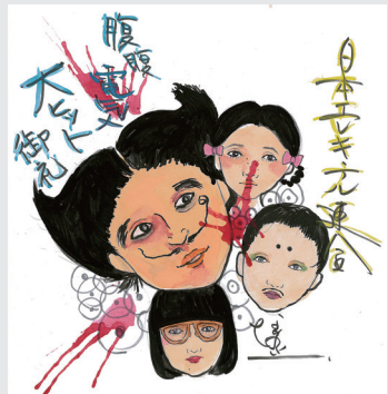
イラスト: 中野聡子 (日本エレキテル連合)

録したDVDが12月24日に発売決定。観る者をエレキテル・ワールドに引きずり込むと間違いないの期待度200%の作品!! ANSB-55182 ¥3,000+税